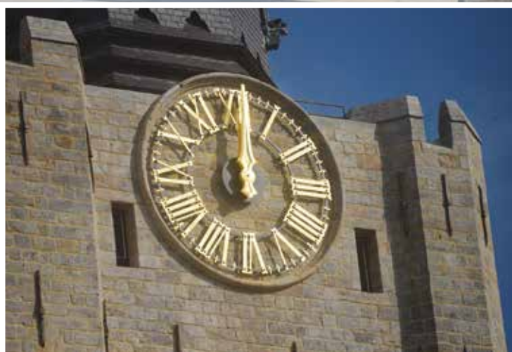
Les cadrans du Beffroi ont été totalement restaurés et brillent désormais sur les quatre faces de l'édifice séculaire.