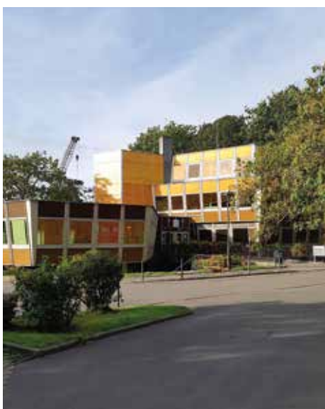
Le nouveau projet d'établissement du CCAS sera proposé pour la fin de cette année.

ment qui sera achevé au 1 er trimestre de 2022 et sera débattu en conseil municipal, ainsi qu'au conseil d'administration du CCAS.