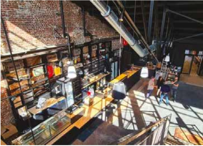
Le food-court, un concept à découvrir.