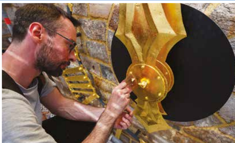
Les travaux de restauration du Beffroi demandent une technicité particulière et un savoir-faire hors du commun.

En flashant le code ci-dessous, retrouvez le discours prononcé par Olivier Gacquerre, Maire de Béthune, à l'occasion de la cérémonie de réouverture du Beffroi, qui a eu lieu le 8 septembre 2021.