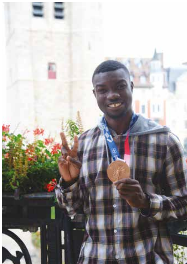
Fabrice Zango a décroché la médaille de bronze à Tokyo et espère faire mieux encore en 2024 à Paris.

Transmettre, c'est important, cela me tient à cœur. Je sais que côtoyer un athlète de haut niveau, cela peut donner des ailes et une motivation supplémentaire. En tant que locomotive du club, j'essaie de le tirer vers le haut et notamment les jeunes, en étant un exemple pour eux et en leur apportant une joie de vivre à travers l'athlétisme.