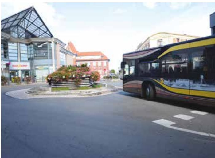
Le rond-point Clemenceau a fait peau neuve.

Emprunté quotidiennement par des milliers de véhicules, dont de nombreux autobus, le giratoire Clemenceau a été réaménagé afin de redonner à ce point stratégique d'entrée en hyper centre-ville une plus grande solidité et permettre le passage des véhicules lourds.