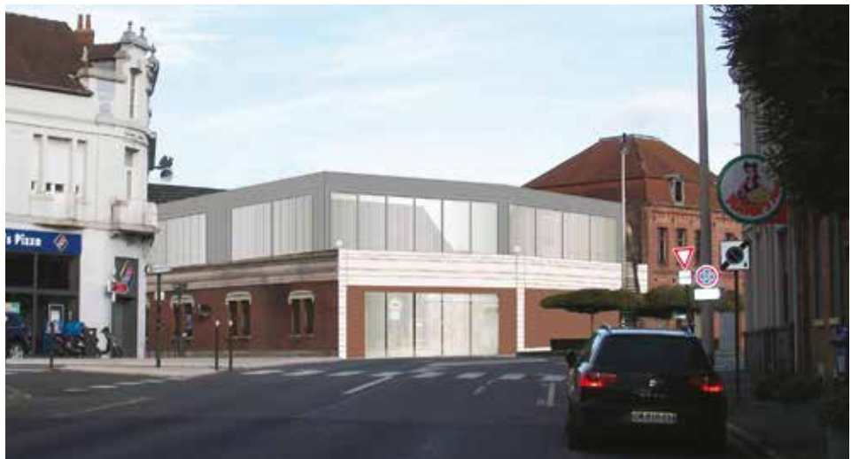
La future salle de sports s'intégrera parfaitement à son environnement.

Les riverains seront informés du calendrier des travaux. La salle de sports devrait être livrée pour le second semestre 2022.