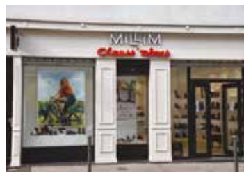
MILLIM Magasin de chaussures 28, rue Arras