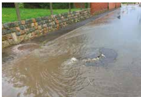
La GEMAPI est un dispositif qui doit permettre de prévenir les inondations.

Cette extension consiste, entre autres, à élargir le nombre de cours d'eau et de fossés entretenus sur le territoire, à engager des actions de lutte contre le ruissellement, l'érosion des sols et les coulées de boue, et à renforcer les aménagements. Un plan d'actions et d'investissements sans précédent a donc été acté et les élus communautaires ont adopté, en solidarité et en responsabilité,