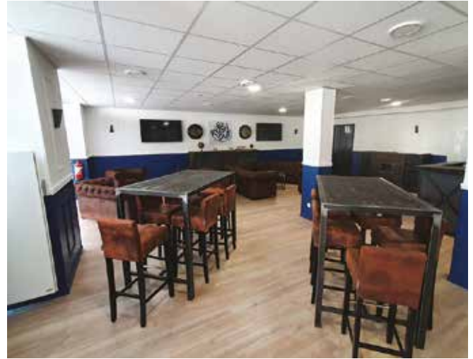
Rush Out vous plonge dans des lieux originaux pour résoudre des énigmes.