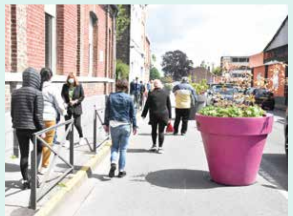
L'expérimentation avait été menée du 17 mai au 15 juillet derniers.

La problématique de la rue Berthelot sera intégrée à une réflexion plus large. En effet, la Ville de Béthune vient d'engager une étude de mobilité qui va durer un an. Celle-ci sera réalisée en concertation avec les habitants. Cette mission a été confiée au cabinet EGIS qui, à l'issue de son travail, émettra des préconisations pour rendre plus fluides les déplacements (création de pistes cyclables, changements de sens de circulation...) et optimiser le partage l'espace public.