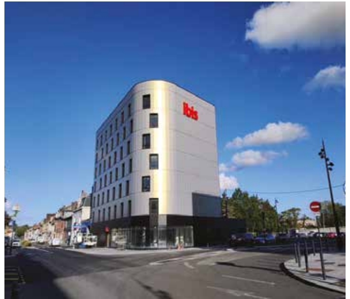
L'hôtel dévoile une silhouette à l'architecture élégante.

été recrutées pour faire fonctionner l'établissement. « Il s'agit majoritairement de locaux. À terme, nous compterons 16 employés. » L'arrivée de l'hôtel est également une bonne nouvelle sur le front de l'emploi.