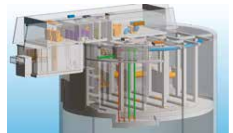
Le bassin sera doté d'une capacité de stockage de 10 000 m 3 .

Ces travaux représentent un coût de plus de 9 millions d'euros et comprendront un volet aménagement paysager avec de la végétalisation en bandes parallèles (bandes d'érables, de graminés, de massifs arbustifs).