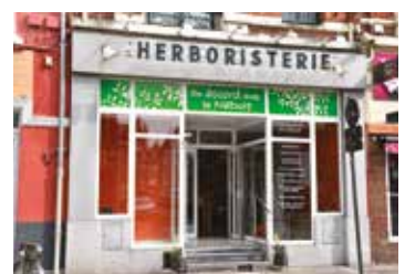
EN ACCORD AVEC LA NATURE Herboristerie, produits naturels et diététiques 146, rue Sadi-Carnot