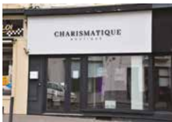
CHARISMATIQUE Prêt à porter féminin 117, boulevard Poincaré