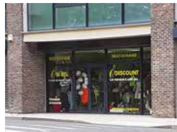
O DISCOUNT Solderie 1, rue Lebas