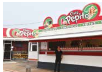
PEPITO Friterie 773, rue de Lille