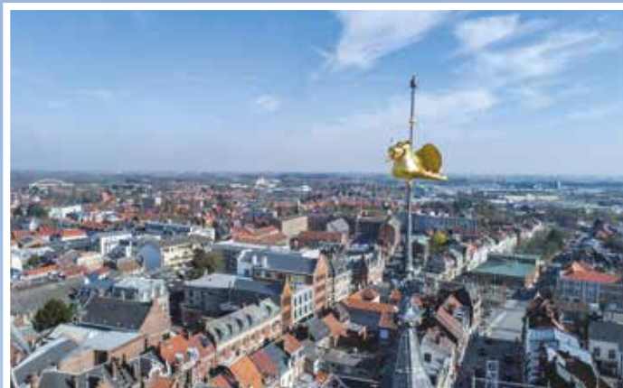
Le dragon Befy arbore désormais une belle couleur dorée et domine la Grand'Place du haut du Beffroi.

Après 18 mois de travaux, le beffroi de Béthune a retrouvé son lustre d'antan. Depuis le début du mois de septembre, le magnifique édifice, qui fait la fierté des Béthunois, est de nouveau accessible. Les artisans ont réalisé de réelles prouesses pour restaurer ce monument du Moyen-Âge. Pour rappel, près d'un million d'euros a été consacré à cette restauration. Une partie a été financée via le Loto du Patrimoine, cher à Stéphane Bern.