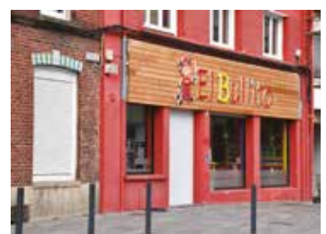
EL BULLITO Restaurant espagnol 352, avenue de Lens