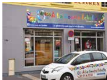
À LA COURTE ÉCHELLE Ressourcerie 667, boulevard Poincaré