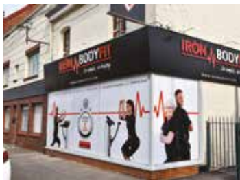
IRON BODY FIT Salle de remise en forme 693, rue de Lille

La Ville de Béthune salue l'arrivée de nouvelles enseignes qui viennent renforcer l'offre et l'attractivité de la commune. Votre commerce est ouvert depuis peu à Béthune ? Contactez la Mairie au 03 21 63 00 00.