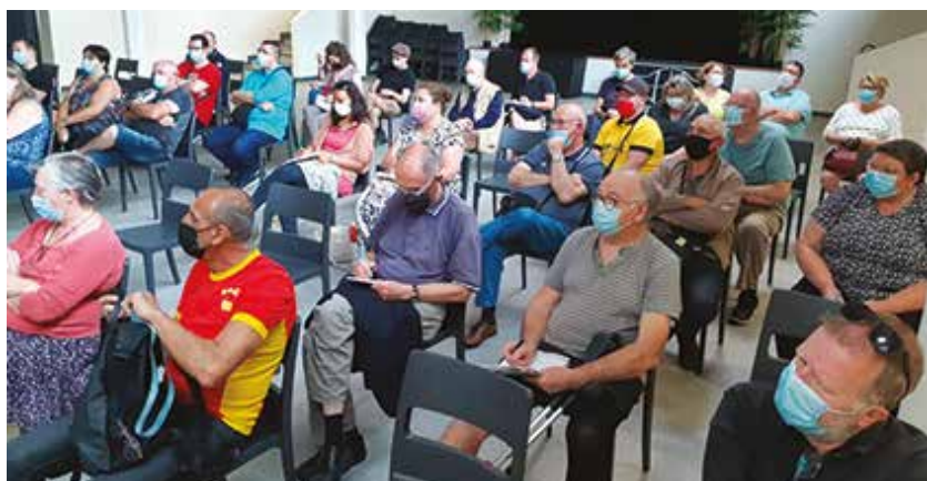
Les conseillers de quartier sont venus nombreux, le 3 juillet dernier.

À noter, qu'en avril 2022, il sera procédé au renouvellement des mandats des conseils de quartier. Un appel à candidatures sera lancé dans quelques mois.