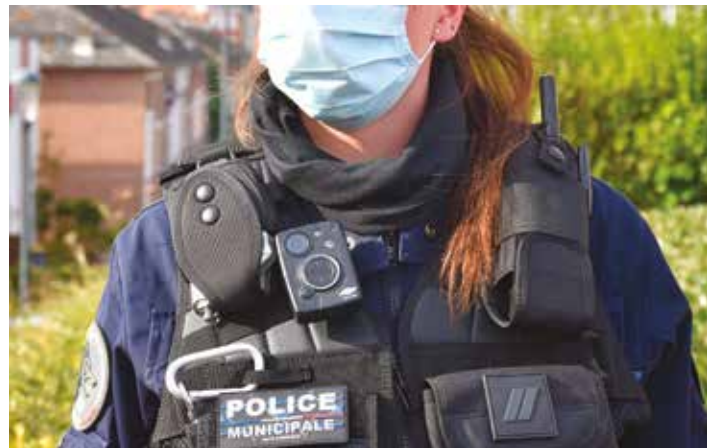
Les caméras piétons sécurisent les citoyens et les agents de police.

Si l'évaluation s'avère probante, l'ensemble des policiers municipaux seront, à terme, équipés de ce dispositif.