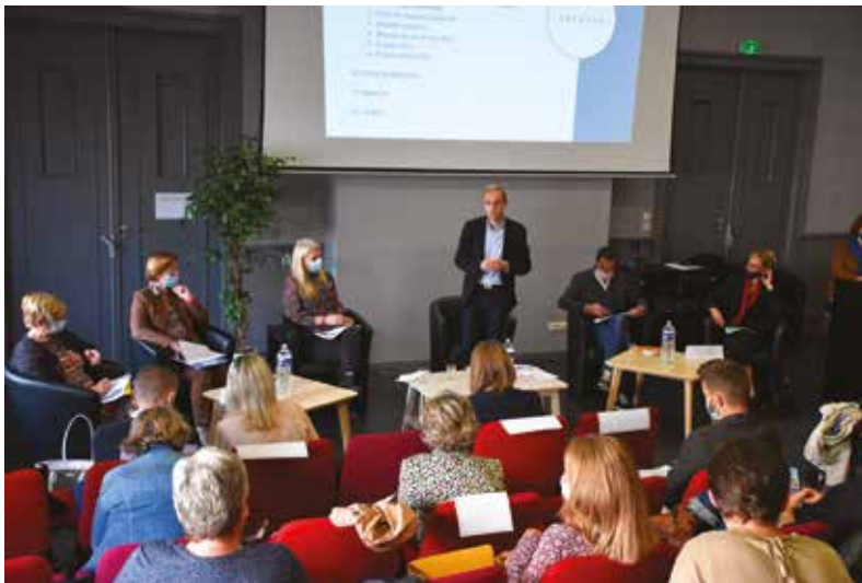
Les acteurs de l'éducation ont pu échanger sur les projets programmés pour cette année scolaire.

Des nouveautés ont été proposées, comme la sensibilisation aux risques d'incendie. En ce début d'année scolaire, les écoles ont également participé aux animations organisées dans le cadre de la Renaissance du Beffroi.